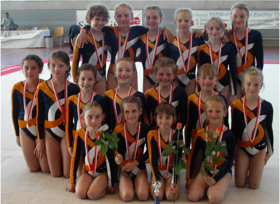
Turnerinnen bis Programm 2, zufrieden nach dem Wettkampf